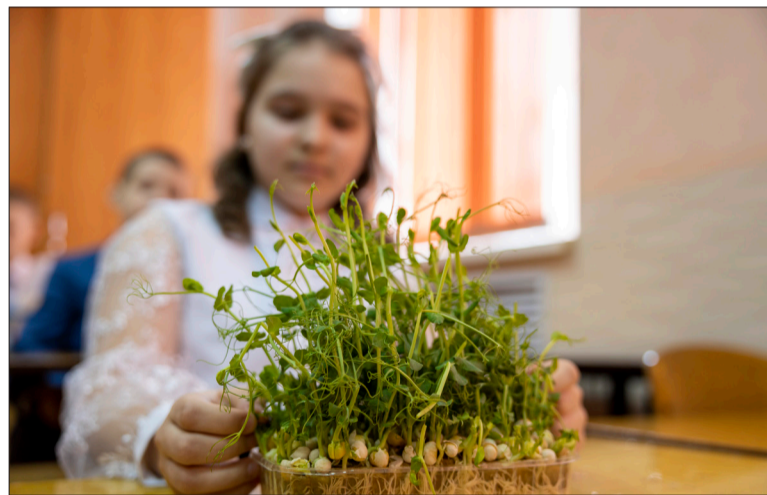
Алия Ризванова презентовала один из образцов микрозелени, который она вырастила вместе с бабушкой

ках), социология, психология, экономика, английский язык. Всегда актуальны информатика, 3D-моделирование, экология.