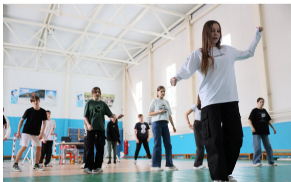
Ребята разучивают движения нового лагерного флешмоба