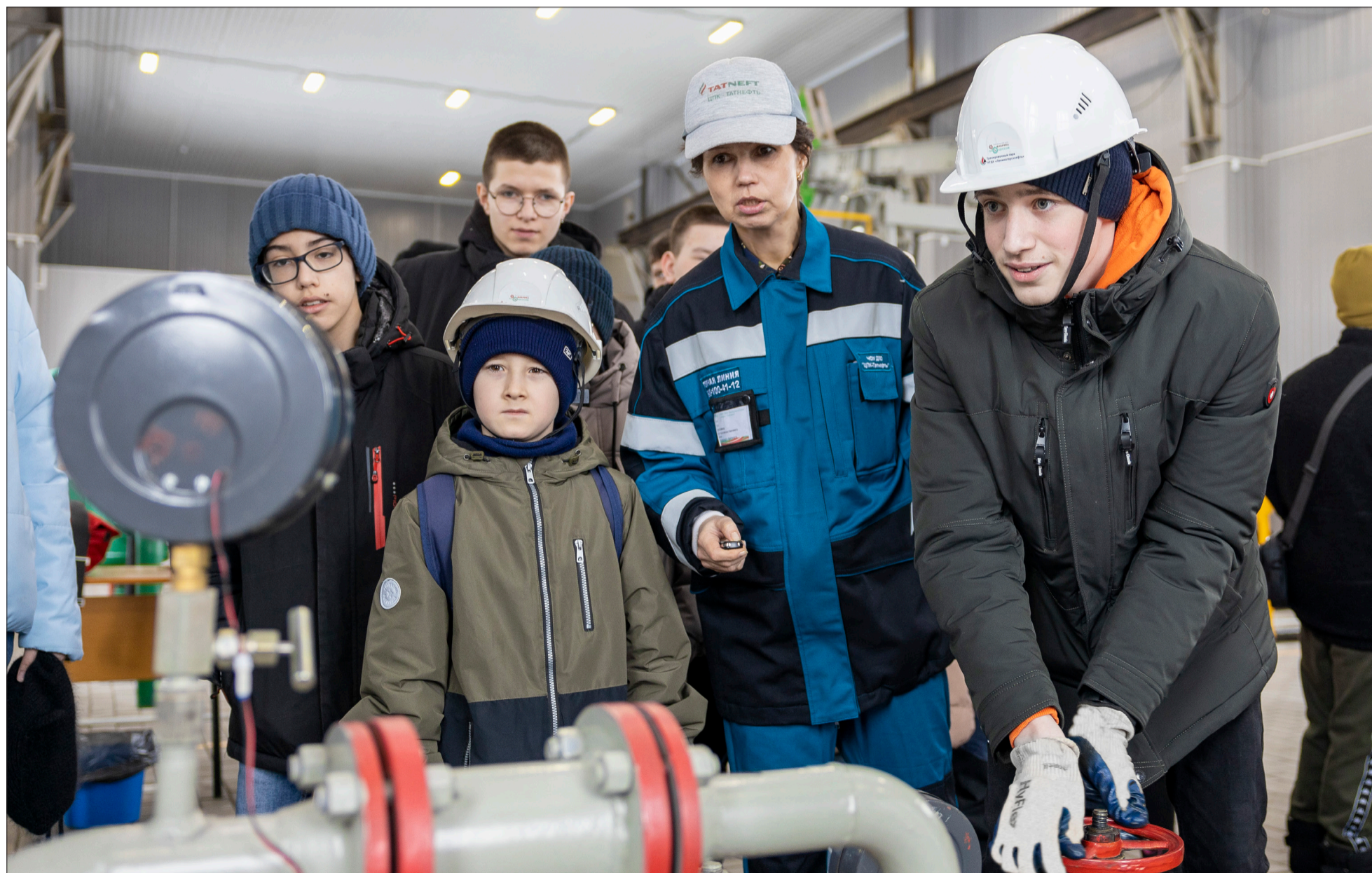
Ребята по очереди учатся осуществлять запуск центробежного насоса на Фабрике процессов

Дети работников «Татнефти» в Лениногорске совершили путешествие в мир нефтяных профессий