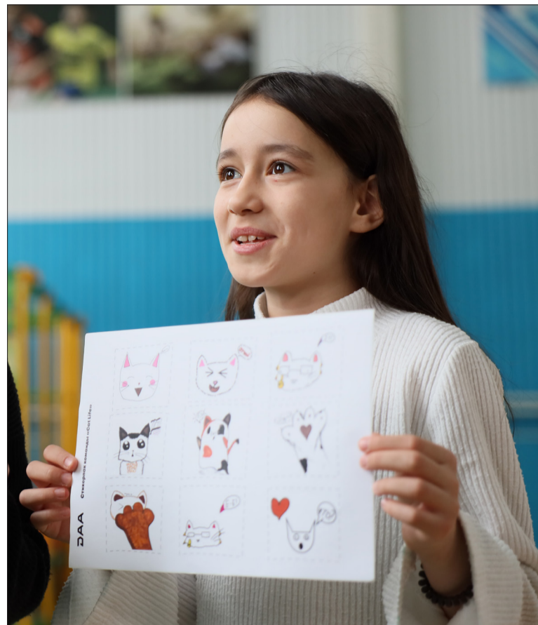
На презентации стикеров