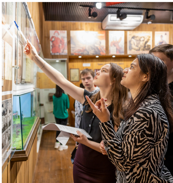
Команды в поисках ответов на исторические вопросы

Напоследок участники представили идеи, как будет выглядеть нефтяной край в будущем. По задумке когда-то на помощь операторам придут роботы и экзоскелеты, геологи активно начнут использовать нейросети для сканирования недр земли, а Компания осуществит одну из своих целей по достижению углеродной нейтральности.