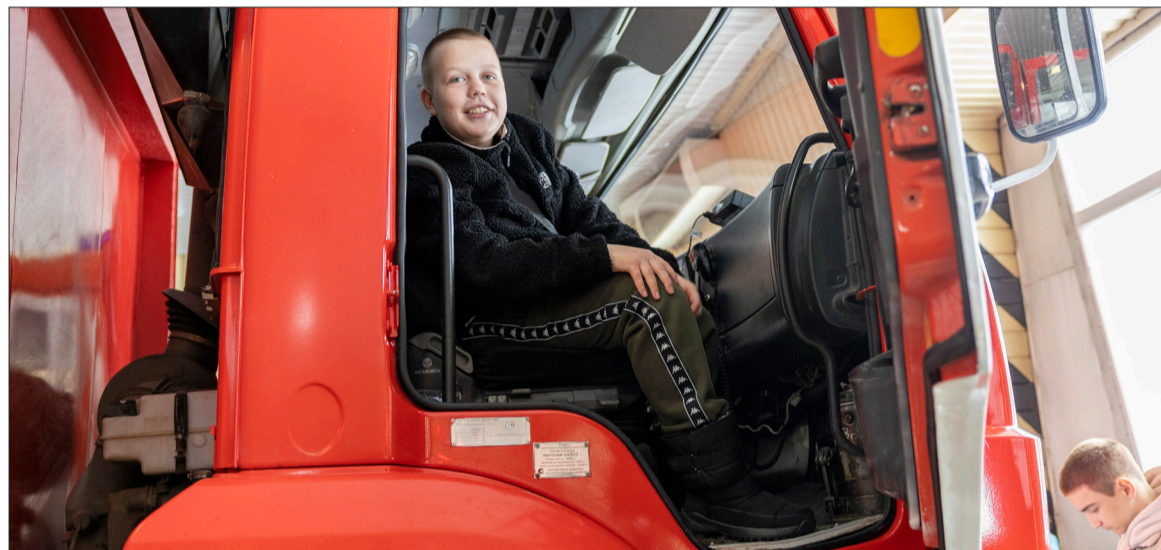
Посидеть в кабине пожарной машины – мечта многих ребят

Дети работников «Татнефти» в Лениногорске совершили путешествие в мир нефтяных профессий